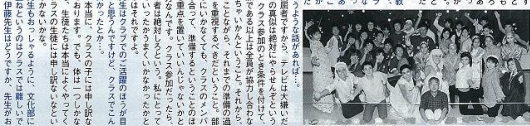
▲2002 蛙鳴祭 "宝塚"