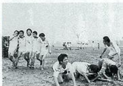
▶男子校時代の体育祭